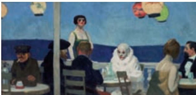
ILL.11 Two Comedians (1966). Huile sur toile. San Francisco, Gary Rogers