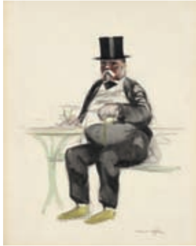
ILL.4 At the Café (1906-1907). New York. Whitney Museum of American Art

L'illustration donne au peintre les moyens de se rendre à Paris, en 1906, 1909 et 1910. Il ne s'inscrit pas dans un cours ou une école mais se promène dans la ville, les musées (le Louvre avant tout), les salons et les galeries. Il découvre les Impressionnistes, le Salon d'Automne ; il est surtout marqué par Edouard Manet, Félix Vallotton et Albert Marquet. Hopper se rend à Londres, en Hollande (admirer Rembrandt et Vermeer) et en Espagne (pour Goya) mais Paris reste son point d'ancrage et d'affection. Le jeune homme pudique s'extériorise : «Je ne me suis jamais senti aussi bien de ma vie» écrit-il à sa mère en 1906. Il peint les bords de Seine, le Louvre, les coins de rue et les silhouettes de ses habitants.