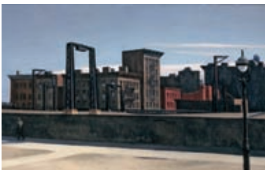
ILL.13 Manhattan Bridge Loop (1928). Andover, The Addison Gallery of American Art

Jeune, le peintre expérimente les effets d'ombre-lumière à la façon des peintres nordiques (Rembrandt, Vermeer) puis les ambiances atmosphériques à la manière des impressionnistes ; une fois de retour aux États Unis, ses tableaux sont marqués par une lumière franche, qu'elle soit électrique ou solaire.