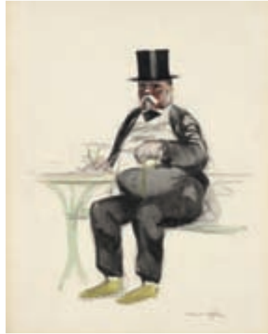
ILL.4 At the Café (1906-1907). New York. Whitney Museum of American Art

L'illustration donne au peintre les moyens de se rendre à Paris, en 1906, 1909 et 1910. Il ne s'inscrit pas dans un cours ou une école mais se promène dans la ville, les musées (le Louvre avant tout), les salons et les galeries. Il découvre les Impressionnistes, le Salon d'Automne ; il est surtout marqué par Edouard Manet, Félix Vallotton et Albert Marquet. Hopper se rend à Londres, en Hollande (admirer Rembrandt et Vermeer) et en Espagne (pour Goya) mais Paris reste son point d'ancrage et d'affection. Le jeune homme pudique s'extériorise : «Je ne me suis jamais senti aussi bien de ma vie» écrit-il à sa mère en 1906. Il peint les bords de Seine, le Louvre, les coins de rue et les silhouettes de ses habitants.