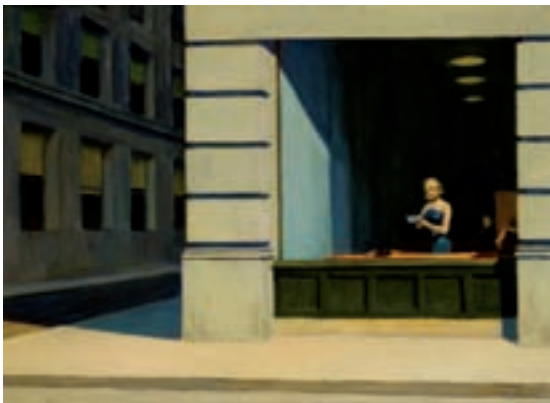
ILL.16 New York Office. 1962. The Montgomery Museum of Fine Arts

Les vues des deux autres tableaux sont plus inattendues puisque prises en hauteur. Hopper montre les derniers étages des immeubles en brique depuis le pont suspendu