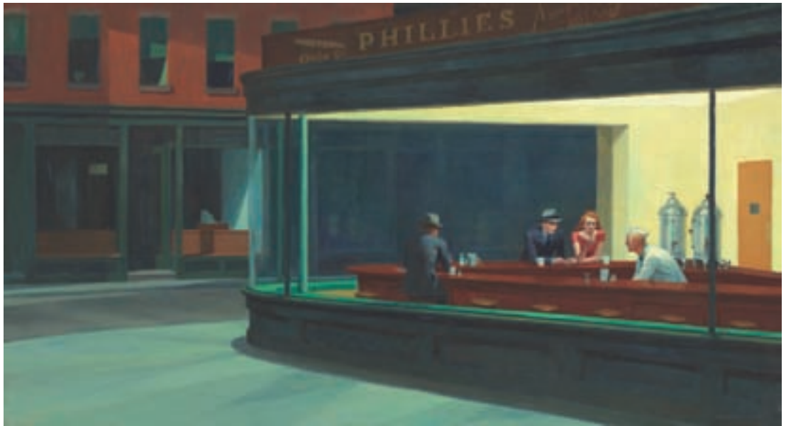
Couverture (II. 1) Nighthawks (1942). Chicago. The Art Institute of Chicago