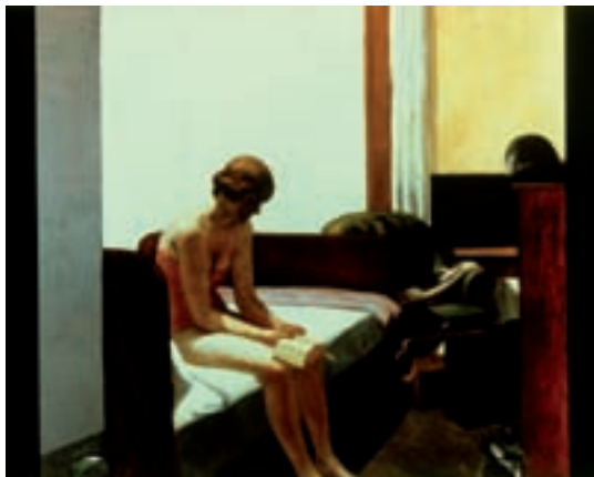
ILL.19 Hotel Room (1931). Lugano. Fondation Thyssen Bornemisza.