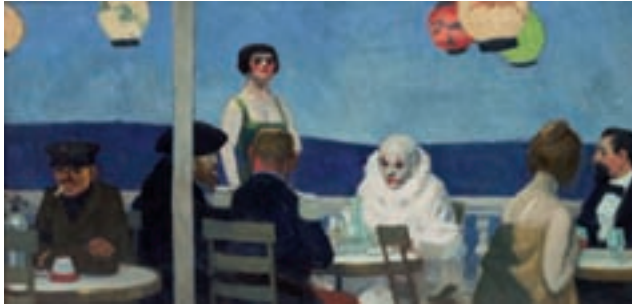
ILL.11 Two Comedians (1966). Huile sur toile. San Francisco, Gary Rogers