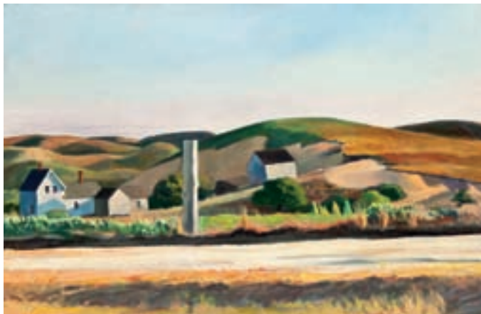
ILL.5 Road and Houses, South Truro (1930-1933). New York, Whitney Museum of American Art

Sa peinture reste marquée par le souvenir de Paris : «J'ai mis 10 ans à me remettre de l'Europe». Il réalise des scènes d'extérieur et des vues ou monuments parisiens (le Pavillon de Flore du Louvre, Notre Dame) ; les ambiances lumineuses rappellent celles des impressionnistes, les cadrages évoquent les audaces de Degas et les formes simplifiées la manière de Cézanne. Il commence à peindre des sujets qui seront plus tard ses thèmes fétiches : des appartements vides ou avec des personnages perdus dans leurs pensées, des fenêtres donnant sur un intérieur ou sur une pièce...