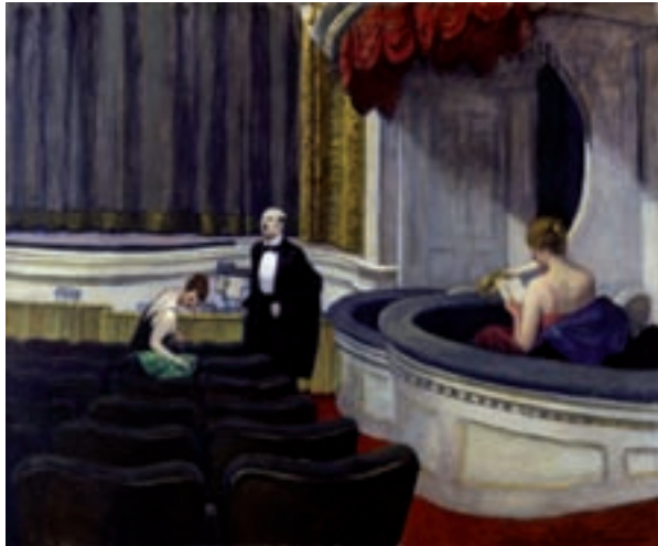
ILL.18 Two On The Aisle. (1927) Toledo, The Museum of Art New York Movie. (1939).