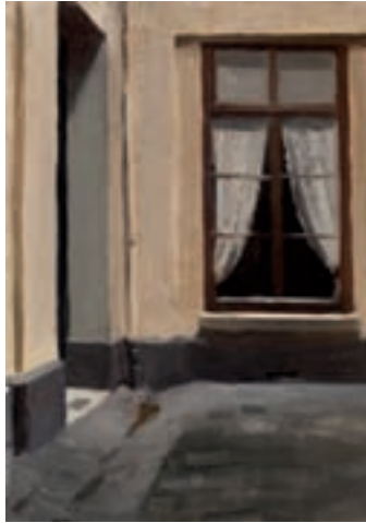
ILL.3 Starway at 48 rue de Lille (1906). New York. Whitney Museum of American Art