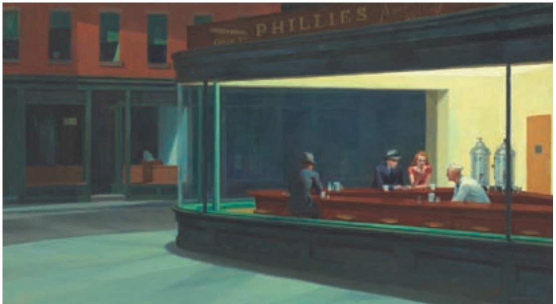
ILL.1 Nighthawks (1942). Chicago. The Art Institute of Chicago