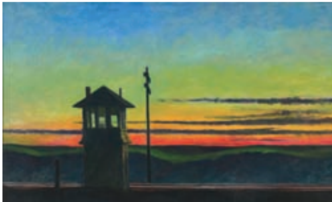
ILL.17 Railroad Sunset. (1929). New York, The Whitney Museum of American Art