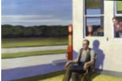
ILL.12 Four Lane Road. (1956). Huile sur toile. London, Tate Modern Gallery

original (effets de plongée ou de contre-plongée le plus souvent), quelquefois improbable (fausse perspective), un encadrement artificiel (l'intermédiaire d'une fenêtre ou d'une vitrine)... Tous les moyens sont exploités, ceux de ses maîtres (Degas, Manet, Marquet) comme ceux de l'illustration ou du cinéma, autre passion du peintre.