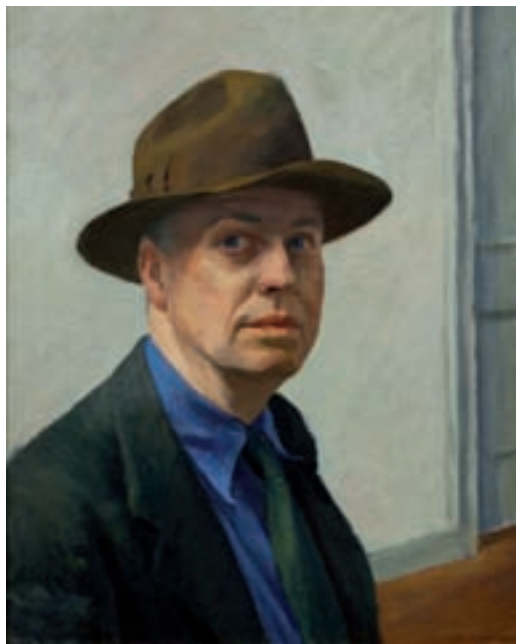
ILL.2 Autoportrait. (1925-1930). New York. Whitney Museum of American Art

Qui est Edward Hopper ? Ses œuvres sont largement réutilisées par les publicitaires et le cinéma. Mais qui connaît vraiment l'artiste ?