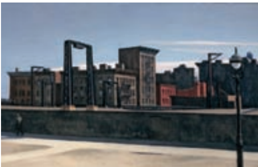
ILL.13 Manhattan Bridge Loop (1928). Andover, The Addison Gallery of American Art

Jeune, le peintre expérimente les effets d'ombre-lumière à la façon des peintres nordiques (Rembrandt, Vermeer) puis les ambiances atmosphériques à la manière des impressionnistes ; une fois de retour aux États Unis, ses tableaux sont marqués par une lumière franche, qu'elle soit électrique ou solaire.