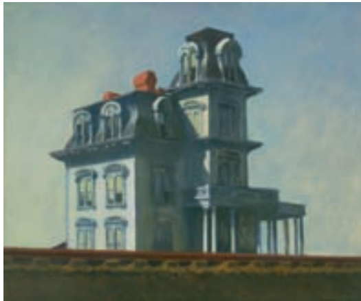
ILL.6 House by The Railroad (1926). New York, The Museum of Modern Art.

En 1930, House by The Railroad (1926) entre dans les collections du tout nouveau Museum of Modern Art (MoMA) de New York ; en 1933 une rétrospective lui est consacrée à New York puis à Chicago.