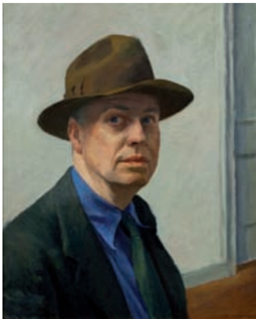
ILL.2 Autoportrait. (1925-1930). New York. Whitney Museum of American Art

Qui est Edward Hopper ? Ses œuvres sont largement réutilisées par les publicitaires et le cinéma. Mais qui connaît vraiment l'artiste ?