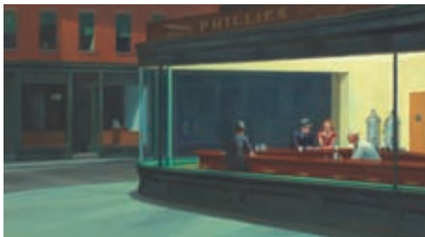
ILL.22 Nighthawks. 1942. Chicago, The Art Institute of Chicago.