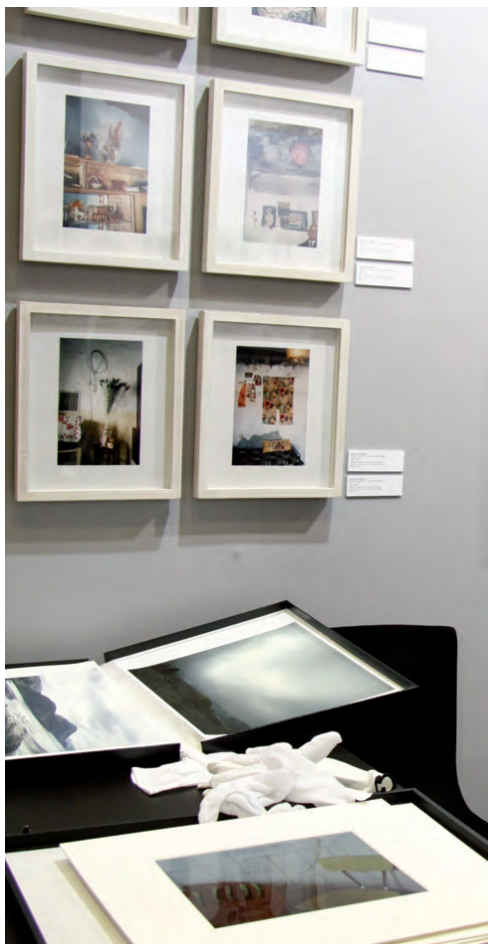
Paris Photo 2010